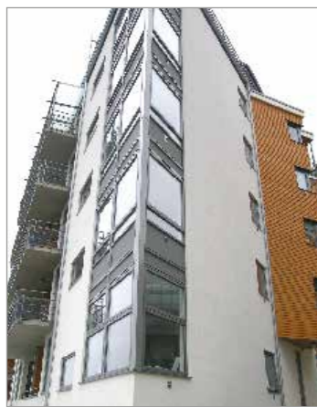
JMs Brf Fyren bjuder på lyx i vardagen – spännande arkitektur kombineras med härlig utsikt.