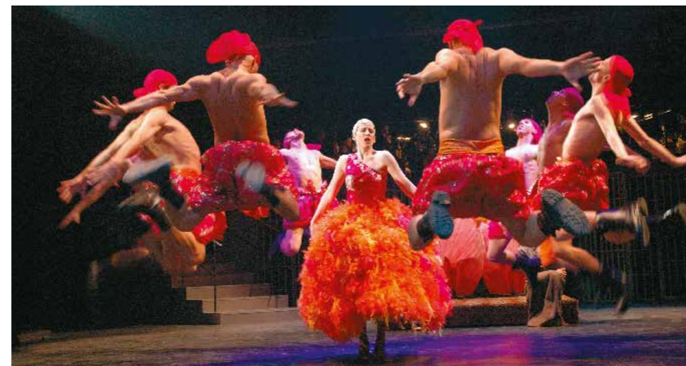
Färgstark föreställning i Båghallarna.

På Dockan sjuder kulturlivet. Väg i väg med Skånes Dansteaters nya lokal ligger Båghallarna där musikalen "Spindelkvinnans kyss" hade premiär den 7 april. Medan Malmö Opera och Musikteaters scen genomgår en omfattande renovering, har hela Operan flyttat ner till Båghallarna där flera spännande uppsättningar väntar.