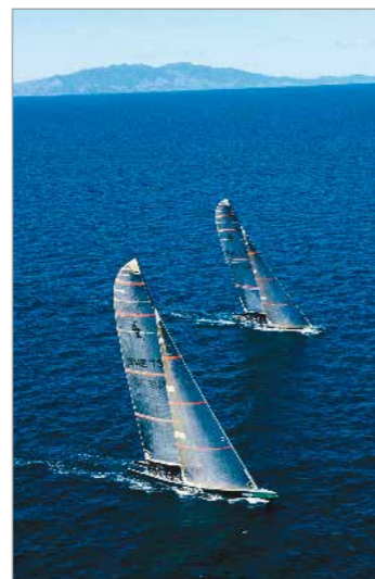
Orm och Örn i Hauraki-bukten, Auckland.

Att det kommer bli liv och rörelse står klart. Med tävlingsbåtarna följer 80-90 domar- och servicebåtar. America's Cup förväntas dra ett stort mediauppbåd till stan. De kommer i första hand att beskriva tävlingen, men liksom i OS och VM så riktas mycket intresse också på platsen och regionen. Planer finns att Mediegymsnasiet vid Dockan