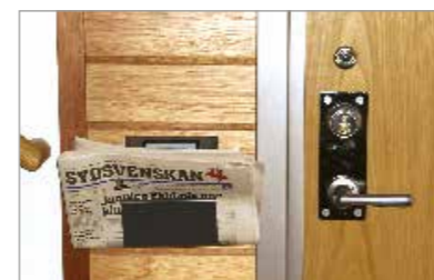
Nyheter utanför dörren varje morgon.

Hon passar på att visa några finesser i huset som gör livet lite bekvämare. I den smakfulla tidningshållaren bredvid ytterdörren hämtar hon