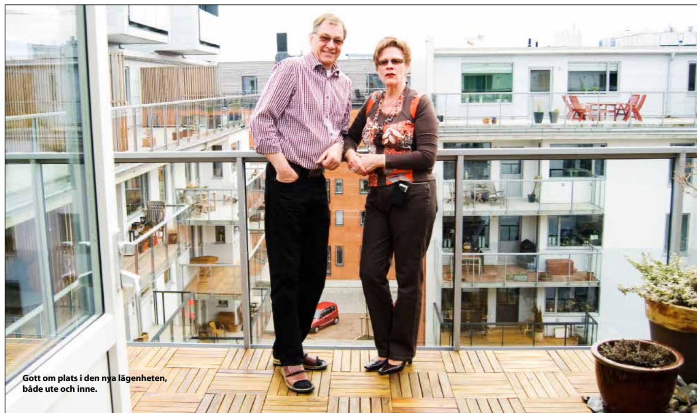
Gott om plats i den nya lägenheten, både ute och inne.