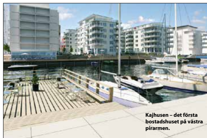
Kajhusen – det första bostadshuset på västra pirarmen.

■ Vid det här laget är Dockan redan ett välkänt bostadsområde, men än så länge har bostäderna byggts på andra sidan marinan.