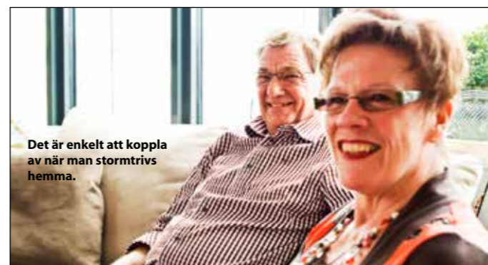
Det är enkelt att koppla av när man stormtrivs hemma.

plats så att de kan ta emot övernattande barnbarn och i bostadsrättsföreningen finns även en gästlägenhet att boka till sina övernattande gäster om man önskar.