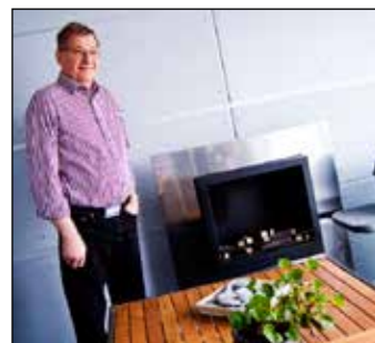
En skorstensfri spis förverkligar drömmen om eldstad på balkongen.

De har precis haft barnbarnen på besök som uppskattar