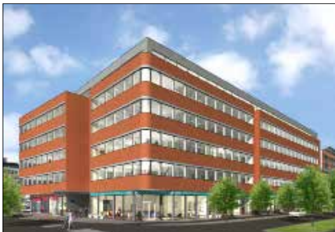
I ÅF-husets entréplan finns det plats för butiker att etablera sig.