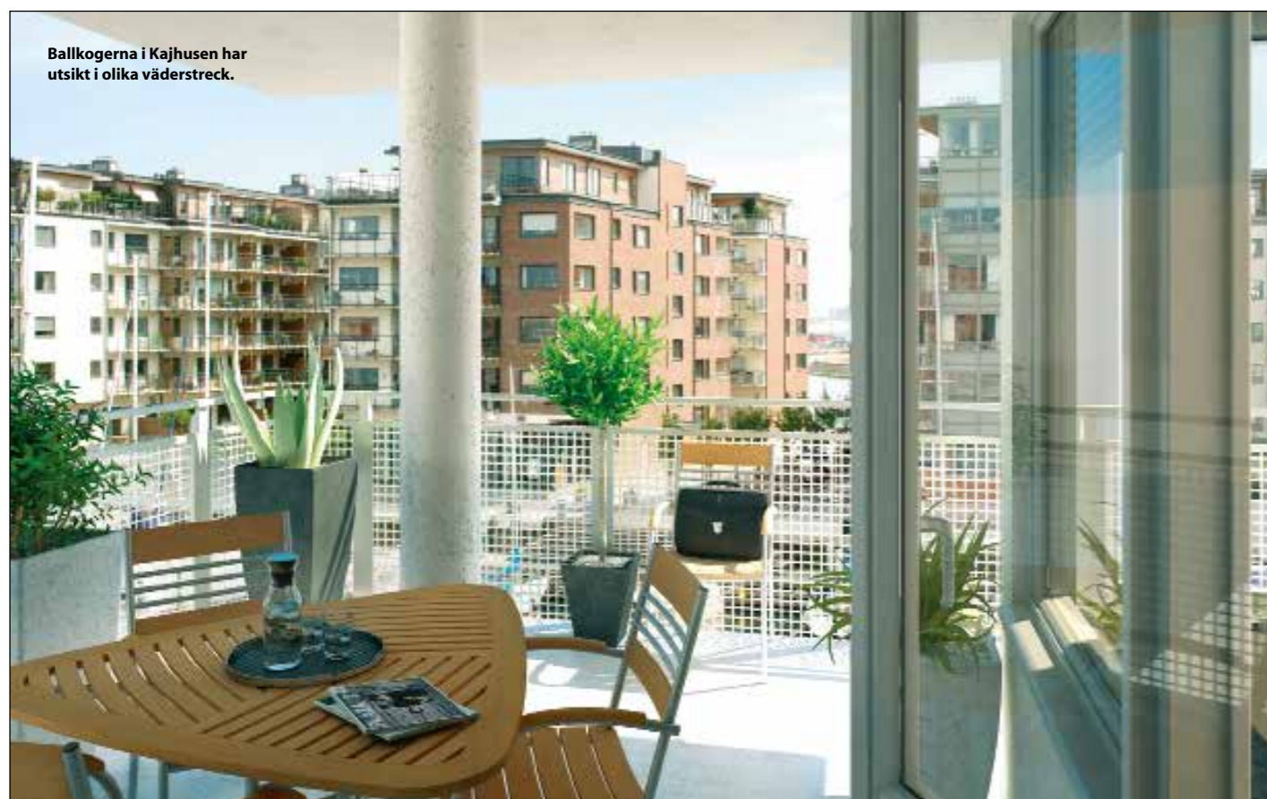
Ballkögerna i Kajhusen har utsikt i olika väderstreck.